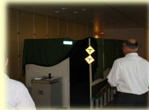
反射輝度体験を簡易ブースにてシート種類によつての反射輝度の違いを体感して頂きました