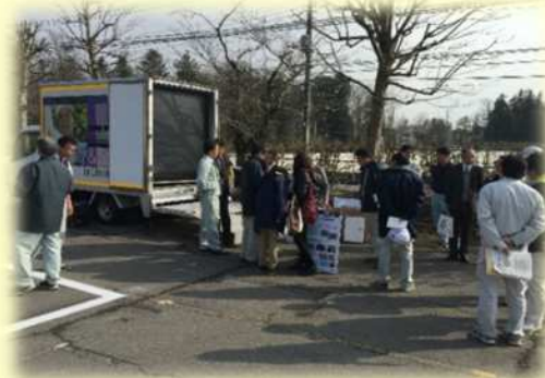
反射輝度体験デモカーにてシート種類によつての反射輝度の違いを体感して頂きました