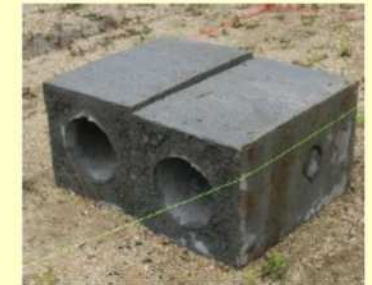
コンクリートブロック (300×450) 64kg